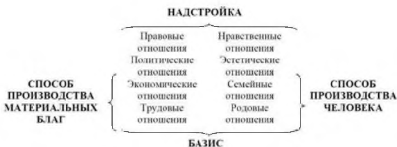
Рис. 1. Базисно-надстроечная модель социума

Базисно-надстроечная детерминация присутствует и в духовной жизни. Обыденное представление о том, что продукт сам по себе считается товаром, «образует базис для фетишизма политико-экономов» 425 . Отрыв от эмпирического базиса порождает иллюзии философии, придает ей характер идеологического, спекулятивного выражения действительности 426 .