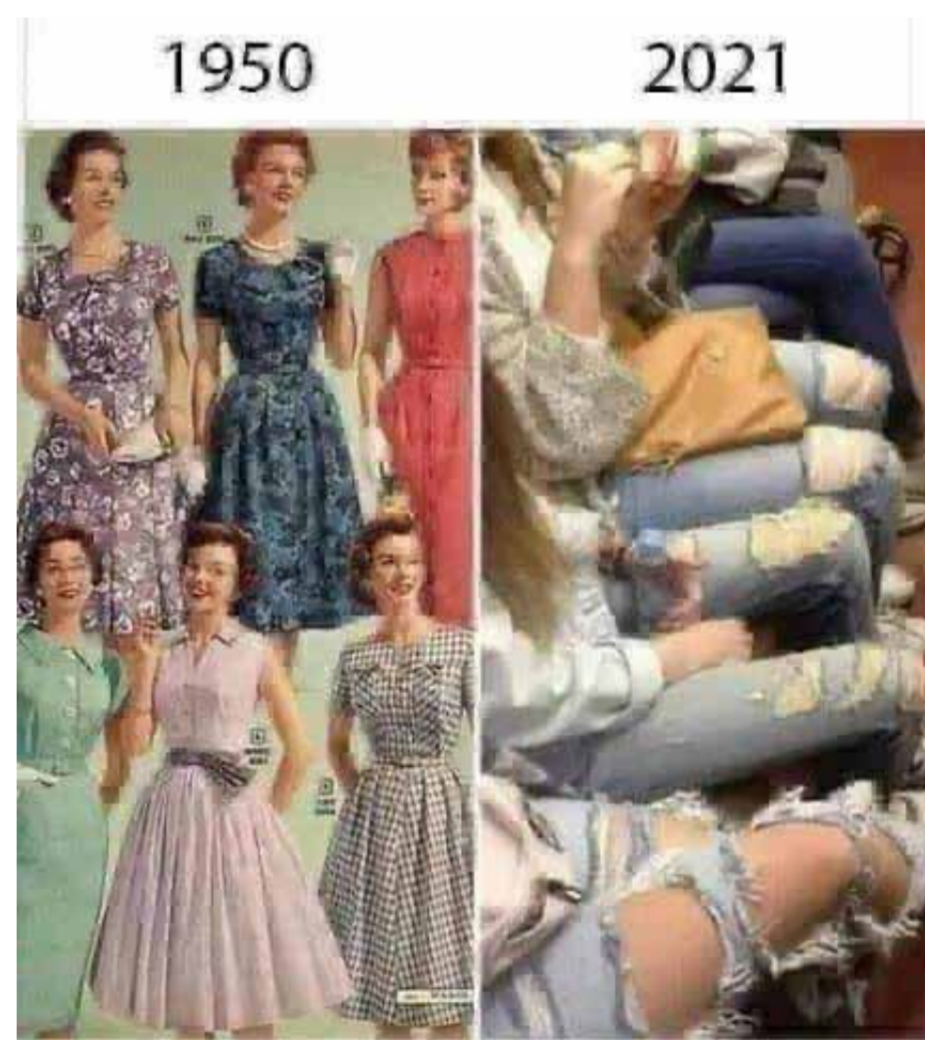
О времена, о нравы!