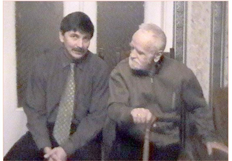
Автор в гостях у В.И. Белова. 2002 г.

Да, в 90-е не печатали ни его, ни Распутина, ни других писателей-патриотов. Фронтовик Юрий Бондарев отказался от ельцинской медали и швырнул: «От предателя я наград не приму!» Понятен был жест человека, проливавшего кровь за страну, которую сдали без боя. И долгие годы читатели вынуждены были изучать творчество выдающегося русского советского писателя, участника Великой Отечественной войны, ордено-