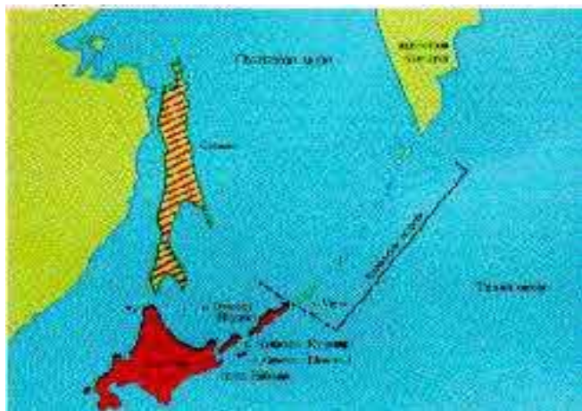
Территории, отошедшие к Японии по Симодскому трактату 1855 г.