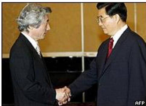
Кто кого перехитрит? Восточная дипломатия в действии.

После встречи Коидзуми сказал журналистам, что остался очень доволен результатами переговоров. В свою очередь Ху Цзинь-тао высказал пожелание, чтобы две ведущие страны региона решали все вопросы посредством диалога.