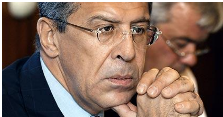
Министр иностранных дел РФ (с 2004 г.) С. Лавров

Так, газета «Санкэй Симбун» опубликовала редакционную статью «Дурные симптомы», в которой расценивала итоги встречи Кавагути с Лавровым достаточно скептически. Свое мнение газета пояснила тем, что настойчивые «наезды» Кавагути, в которых она экспансивная дама всемерно пыталась убедить своего собеседника в необходимости «скорейшего решения проблемы принадлежности четырех островов и скорейшего заключения мирного договора», встретили «настойчиво неопределенную позицию Лаврова». Еще большие основания для скепсиса газета увидела в том, что Кавагути не была принята Путиным, хотя все прежние визитеры в ранге министра иностранных дел, как правило, имели встречу с первым лицом.