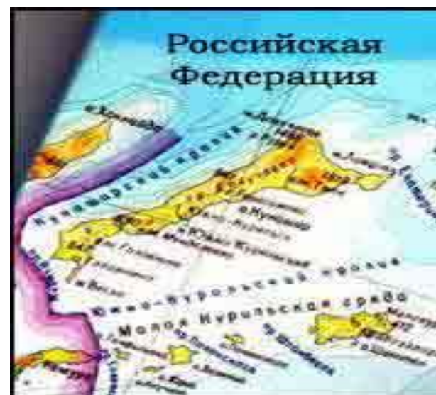
Южные Курилы и побережье Хоккайдо

зом не признает принадлежность упомянутых островов Японии , а лишь соглашается ради добрососедства уступить часть своей территории — после подписания мирного договора. Так что никакого «возвращения» в декларации не было, и цепляться за эту статью как гарантию получения японцами двух островов южнокурильской группы нет никаких оснований.