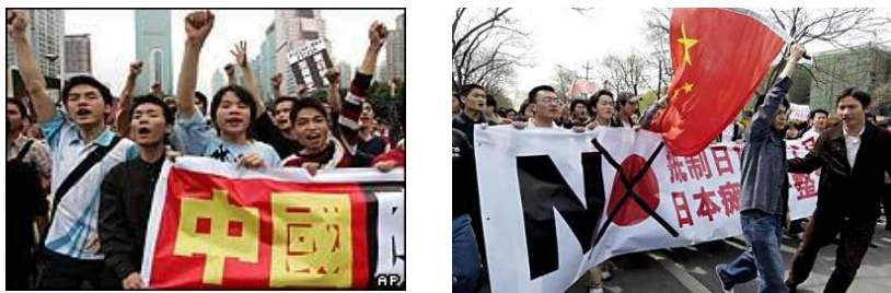
Антияпонские демонстрации в Китае в апреле 2005 г.

В-шестых, 10-11 апреля по Китаю прокатились массовые антияпонские манифестации, участники которых били стекла в японском посольстве в Пекине и в консульствах в других городах, а также в универмагах, торгующих японскими товарами. Побили и нескольких попавшихся под руку японских студентов.