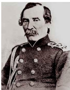
Вице-адмирал флота Российской империи граф Евфимий Васильевич Путятин

План спасения «Дианы» почти удался, хотя казался безумным — приделав временный руль взамен оторванного цунами и кое-как залатав многочисленные пробоины, максимально облегченный от пушек и всех возможных грузов корабль повели в соседнюю с симодской бухту Хэда, чтобы завалить там его на отмель для починки.