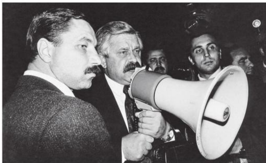
И.о. президента РФ А.Ружкой выступает перед защитниками Конституции Российской Федерации