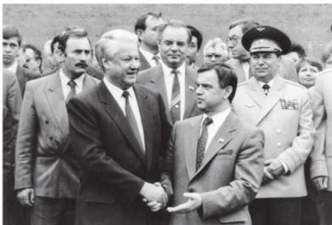
Делегация членов Верховного Совета РФ во время празднования Дня Победы 9 мая 1993 г. на Поклонной горе (слева направо): на первом плане Президент РФ Б.Ельцин и Председатель Верховного Совета РФ Р.Хасбулатов. На втором плане: А.Аслаханов, Ю.Воронин, маршал Е.Шапошников