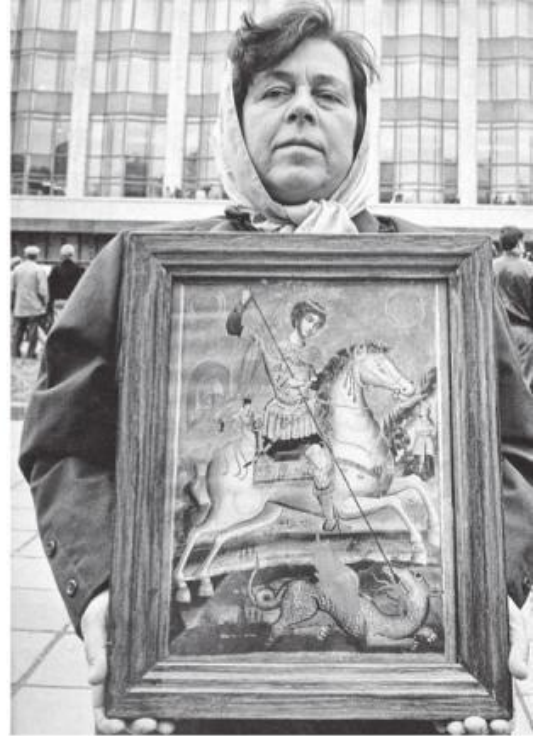
Сколько же нужно было перестрадать этой женщине, чтобы искать защиты у Бога против произвола властей! Но еще горше сознавать, что не услышал Иисус Христос тех молитв, не спас от расстрела защитников правды, защитников Конституции