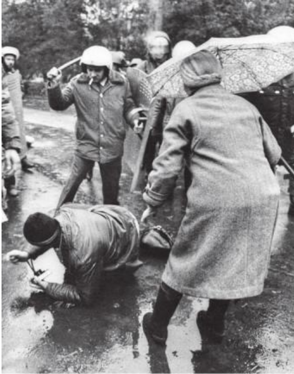
Так загоняли за спираль Бруно: дубинками, дубинками, дубинками...