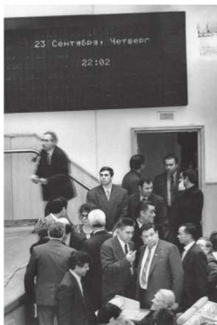
Перерыв в заседании. Никто не расходится. Все обсуждают сложившуюся ситуацию