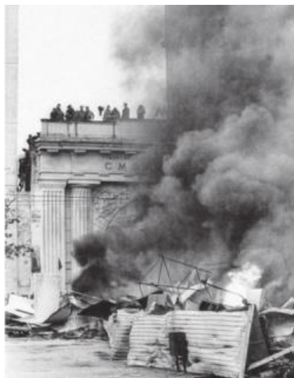
У станции метро «Смоленская»