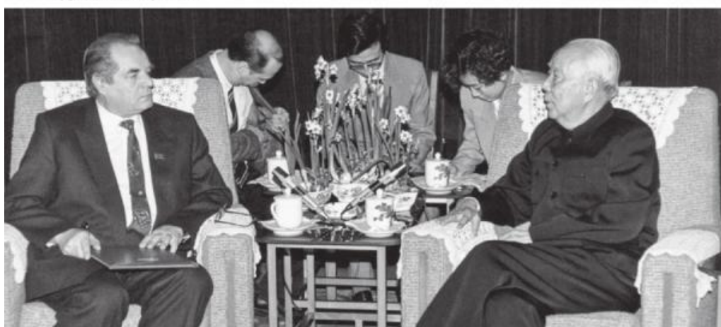
Во время поездки в Китайскую народную республику. Переговоры с председателем Постоянного комитета Всекитайского собрания народных представителей (ВСНП КНР) Вань Ли. Январь 1993 г.