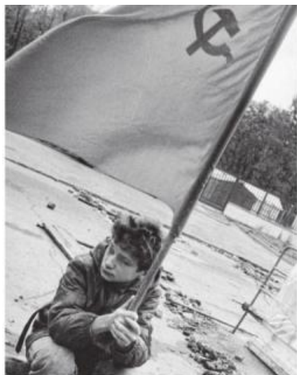
На улицах Москвы