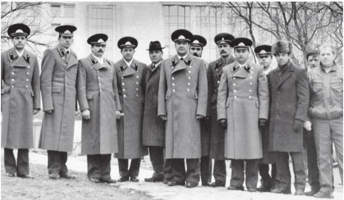
Офицеры-патриоты г. Подольска Московской области, вставшие на защиту Конституции РФ и Дома Советов России