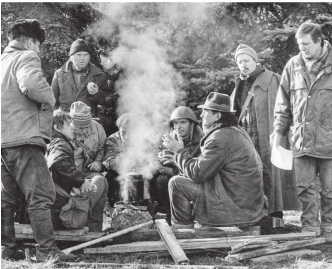
Холодная осень 93-го. Уже в конце сентября выпал первый снег. У костров приходилось не только согреваться, но и кипятить воду, так как «мэрская власть» Ю. Лужкова и К о «гуманно» распорядилась отключить в Доме Советов России не только электричество, но и горячую воду