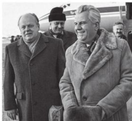
Встреча развальщиков Советского Союза: слева – Председатель Верховного Совета Белоруссии С.Шушкевич, справа – Президент Украины Л.Кравчук