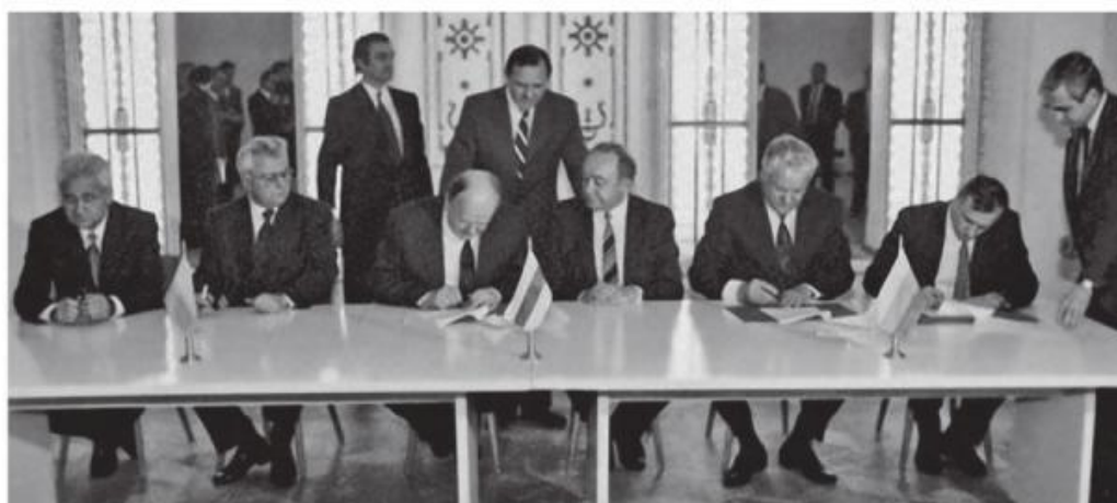
Предатели Отечества и развальщики СССР ставят свои подписи под Беловежскими документами (слева направо): В.Фокин и Л.Кравчук (от Украины), С.Шушкевич и В.Кебич (от Белоруссии), Б.Ельцин и Г.Бурбулис (от России)