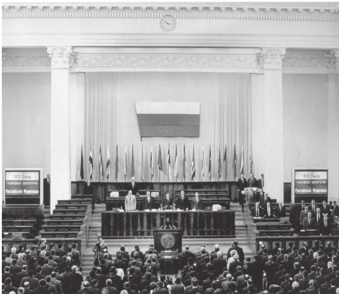
Открытие VII Съезда народных депутатов РСФСР. Звучит Гимн России. В президиуме съезда (слева направо): Р.Абдулатипов, Б.Ельцин, Ю.Воронин, Р.Хасбулатов, Н.Рябов, В.Соколов. Большой Кремлевский Дворец, Декабрь 1992 г.