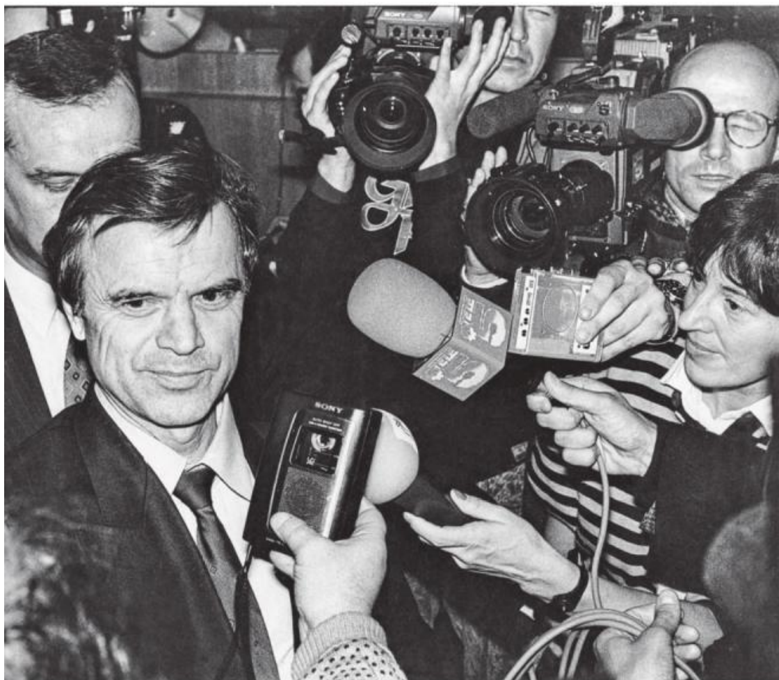
Р.Хасбулатов в ночь с 26 на 27 сентября 1993 г. через телекомпанию CNN обращается к мировой общественности с призывом – не допустить расстрел российского парламента, запланированный министром внутренних дел В.Ериным на утро 27 сентября. На весь мир прозвучали слова этого холуя-министра: «Борис Николаевич! К одиннадцати утра я покажу Вам заваленный трупами депутатов зал заседания Десятого съезда!» Обращение Р.Хасбулатова было услышано, и расстрел парламента был отложен... на неделю, до 4 октября 1993 г.