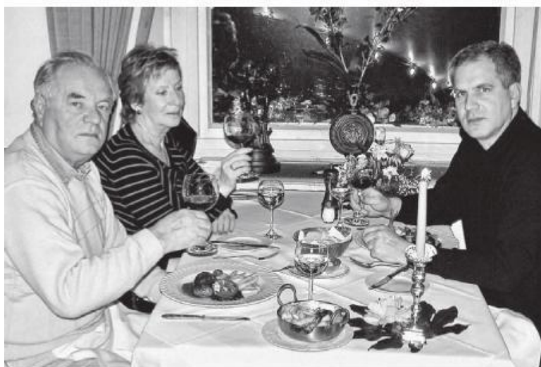
В семейном кругу