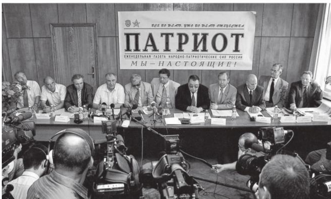
Десять лет спустя. Пресс-конференция в редакции еженедельника «Патриот» с участниками ГКЧП. Слева направо: О.Бакланов, В.Генералов, А.Тизяков, Д.Язов, Г.Янаев, М.Земсков, В.Павлов, В.Стародубцев, О.Шенин, В.Варенников, В.Болдин