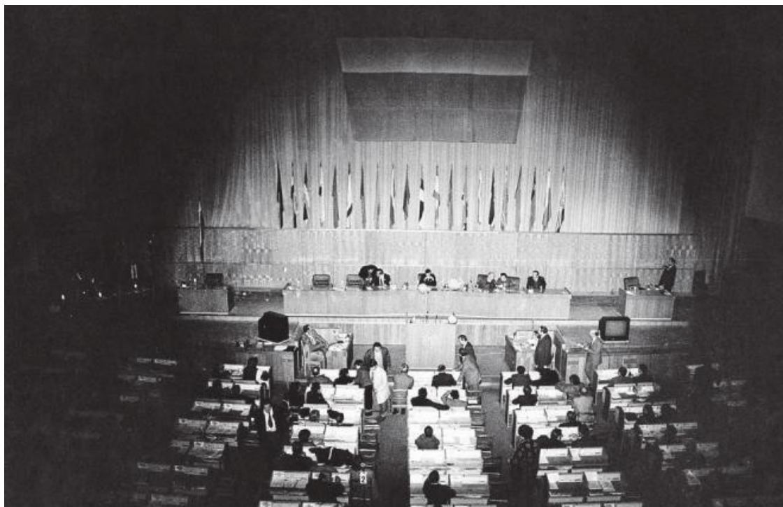
Заседание X (Чрезвычайного) Съезда народных депутатов Российской Федерации продолжалось при свечах, когда лужковская власть отключила в Доме Советов электричество