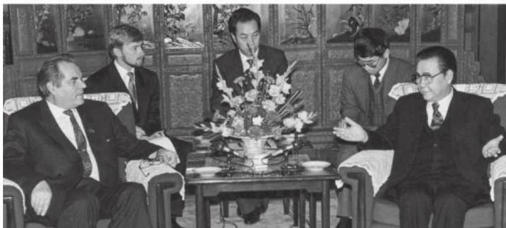
Переговоры с премьером Государственного Совета КНР Ли Пэнгом. Январь 1993 г.