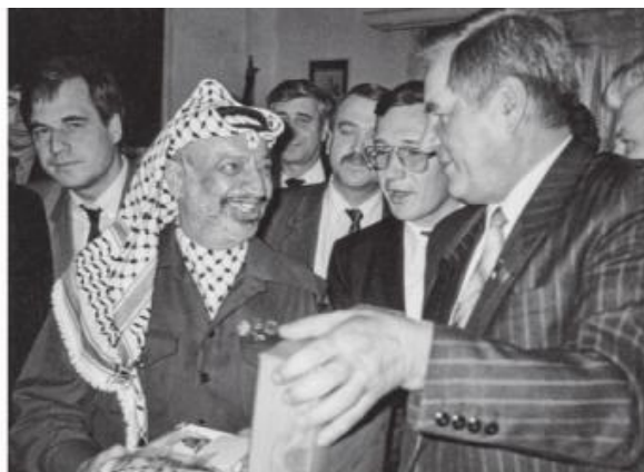
Председатель Исполкома ООП Я.Арафат вручает памятный сувенир делегатам Верховного Совета РФ