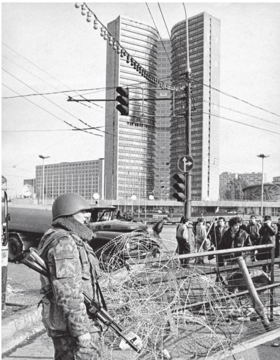
У бывшего здания СЭВ. «Новые» сувениры «новой, демократической» России – спираль Бруно