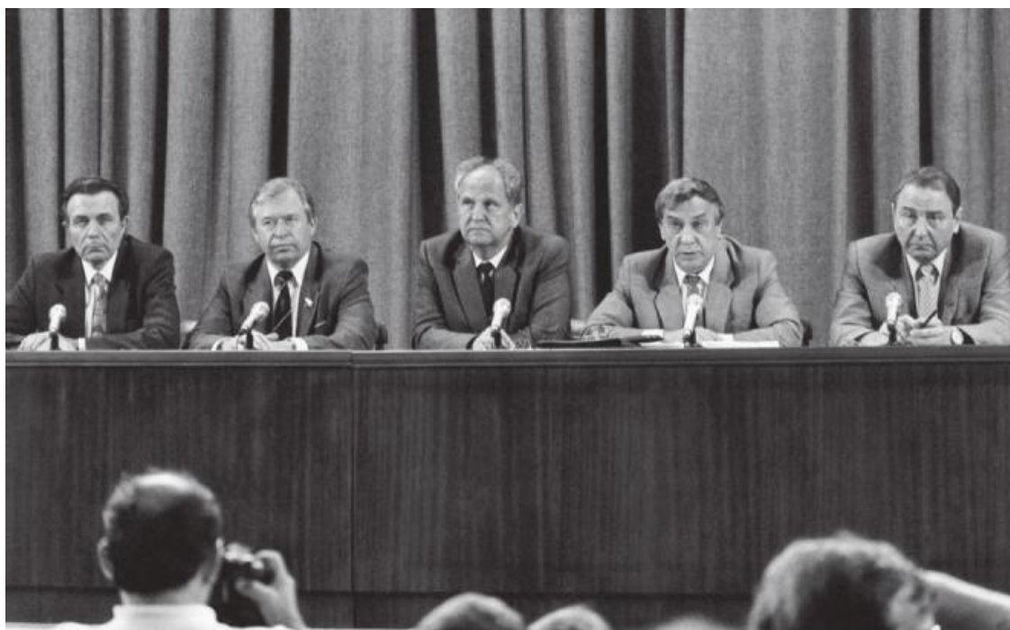
Пресс-конференция исполняющего обязанности президента СССР Г. Янаева (второй справа) в Пресс-центре МИД СССР 19 августа 1991 г. В ней приняли участие члены ГКЧП (слева направо): А.Тизяков, В. Стародубцев, Б.Пуго и первый заместитель председателя Совета обороны при президенте СССР О.Бакланов